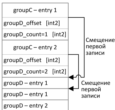
Рисунок 2. Схема двухуровневого вложения компонентов

Повторяющиеся компоненты, в свою очередь, также могут включать в себя повторяющиеся компоненты или поля. В этом случае каждая запись компонента ссылается на свою группу записей вложенного компонента.